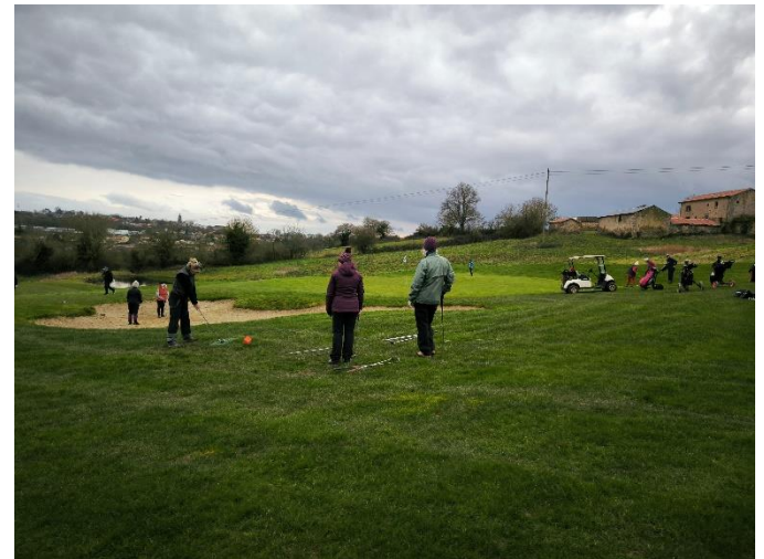
Rencontre Féminine fin mars ( PP)