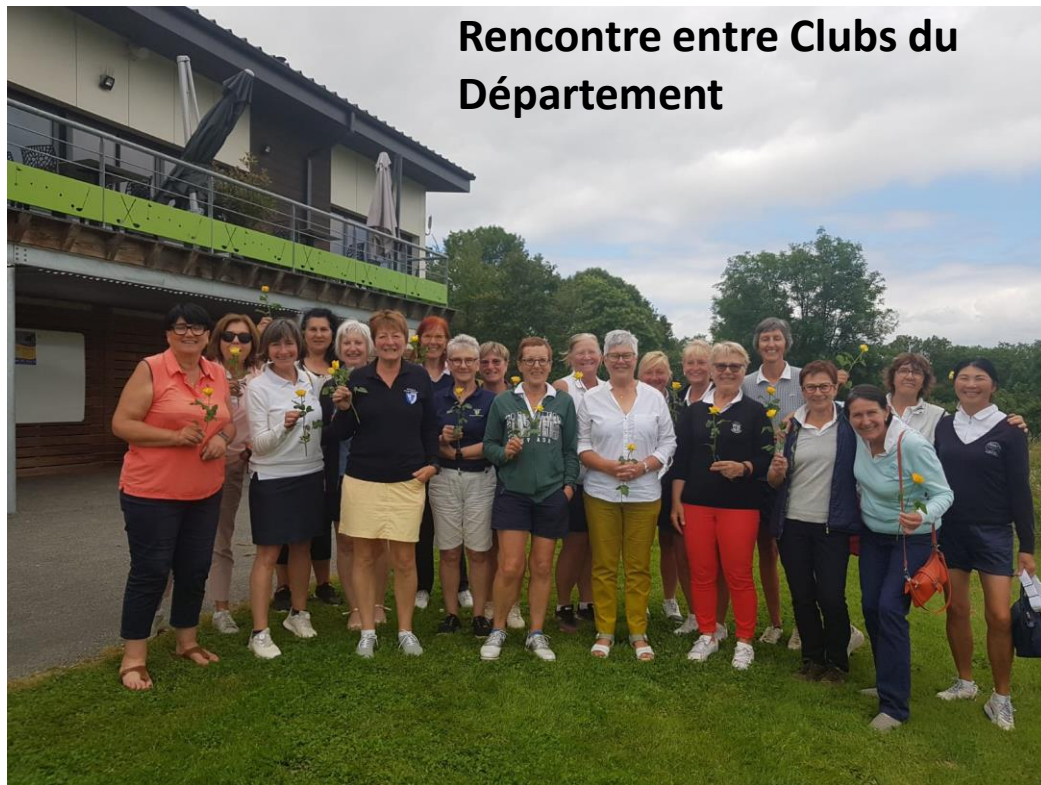
Rencontre entre Clubs du Département