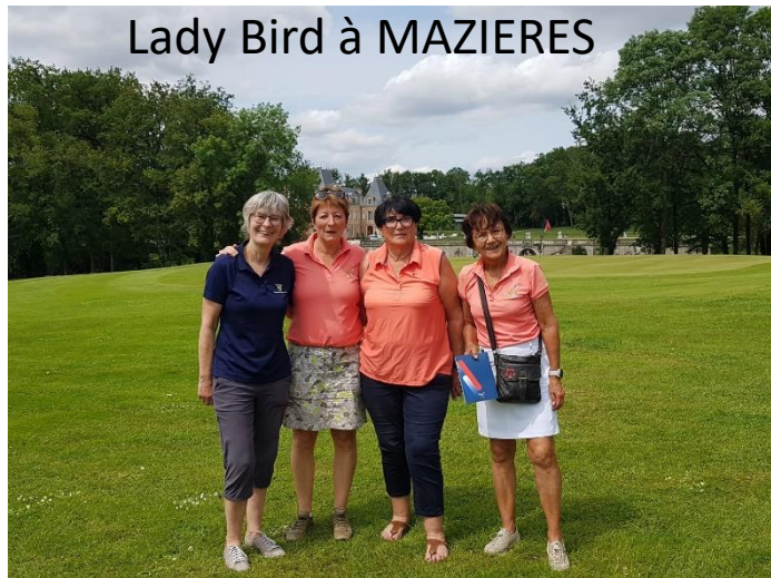
Lady Bird à MAZIERES